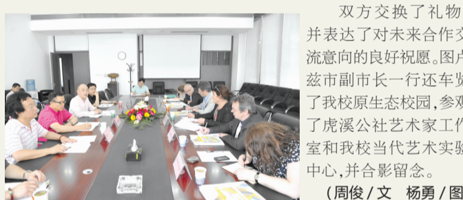
双方交换了礼物，并表达了对未来合作交流意向的良好祝愿。图卢兹市副市长一行还参观了我校原生态校园，参观了我校溪公社艺术家工作室和我校当代艺术实验中心，并合影留念。(周俊/文)

文森特拉·德·科马尔蒙对我校热情与友好的接待表示感谢。她介绍了图卢兹大学和图卢兹美术学院的情况，对双方合作取得的成绩给予了肯定，并积极回应了我校提出的合作意向。图卢兹市表演和美学校校长依夫·罗伯特介绍了图卢兹美术学院将承办“9月之春艺术家”活动，希望双方师生可以在两个院校和两个城市进行艺术展览交流。