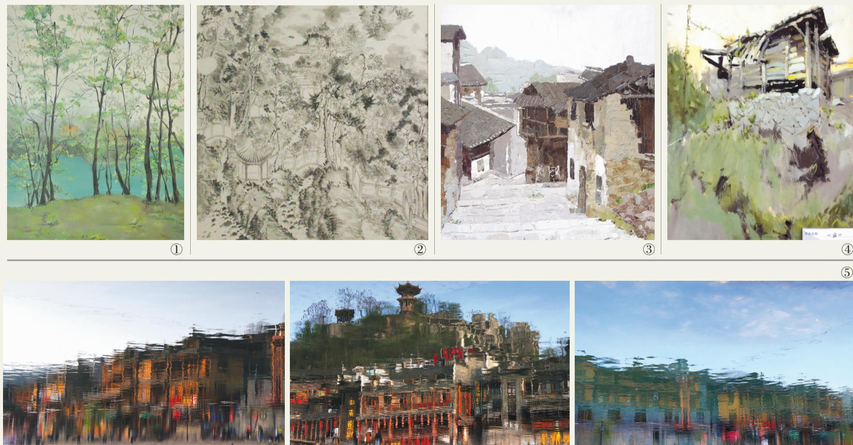
①叶吉泉《风景写生》油画系 ②曲明明《峨眉写生斗方》中国画系 ③李佳霖《街景》版画系 ④刘洪静《痕》影视动画学院 ⑤郝广策《新媒体艺术系》 ⑥潘妍《风景写生》油画系 ⑦邹建方《风景写生》油画系 ⑧袁野《万年寺》中国画系 ⑨朝朝《风景写生》设计艺术学院 ⑩王芳《云南写生1》美术教育系 ⑪廖代扬《山与路》中国画系 ⑫蒋知岑《古镇》影视动画学院 ⑬王杜若《风景写生》油画系 ⑭董俊坤《无语》应用美术系